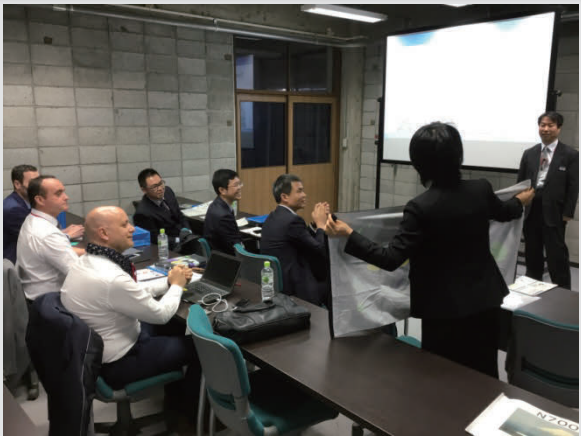
運転訓練用シミュレータ国際会議