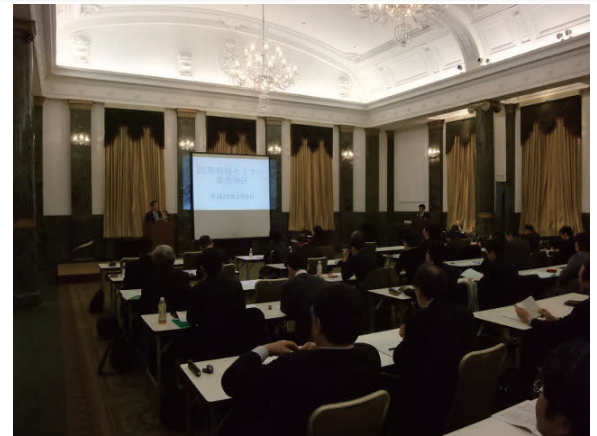
平成28年度 国際規格セミナー (一般編・東京開催)