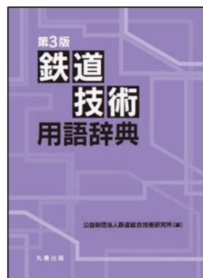
[書籍版 丸善出版(株) 発行]

国土交通省監修の各設計標準、及びそれらに対する理解を深めるための設計指針・設計計算例等