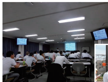
鉄道技術講座開講例 (座学・現場実習)

鉄道構造物に関する技術基準の制定や改訂にあたって、その要点をわかりやすく解説する講習会