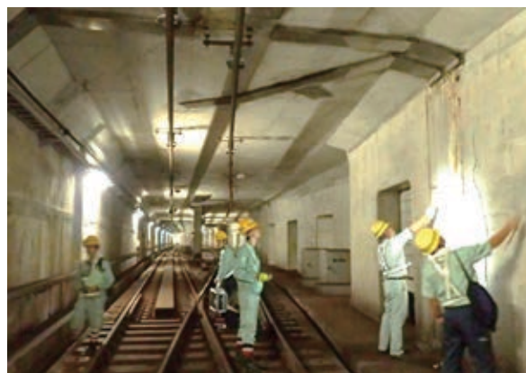
トンネルの変状に関する現地調査の様子

特に重点をおいた地域鉄道への技術支援については、現地調査等が18社22件、文献・研究室の見解等の提示が40社66件となりました。