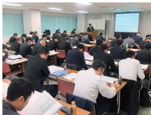
鉄道橋りょうの維持管理講習会の様子 (大阪会場)

会員用ホームページを通じて、電子図書館システム、安全データベースおよび推進センターの成果物等を提供しています。また、携帯端末等からもアクセスが可能な会員用ホームページライトおよび公開ホームページも提供しています。