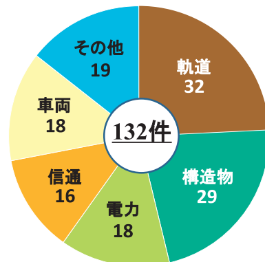
分野別技術支援の実施件数