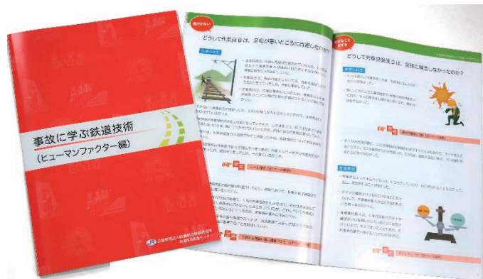
事故に学ぶ鉄道技術 ヒューマンファクター編