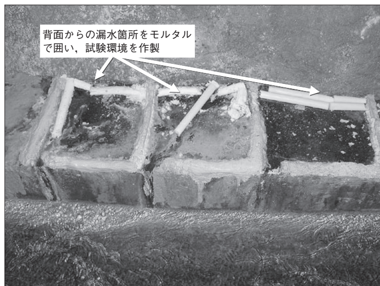
図3 漏水箇所をモルタルで囲い、異なる漏水量・薬剤で行った試験の様子