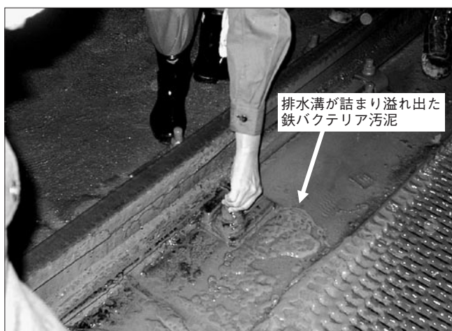
図2 排水溝が詰まり鉄バクテリア汚泥が溢れ出た例

所の上流側に設置しますが、漏水の状況によって必要量設置できない場合、薬剤を定期的に必要濃度となるよう投入することになります。なお、薬剤受けは、適宜フィルム等で孔をふさぐことにより、漏水がオーバーフローするようにするなど、薬剤と漏水との接触状況を調節することも可能です。