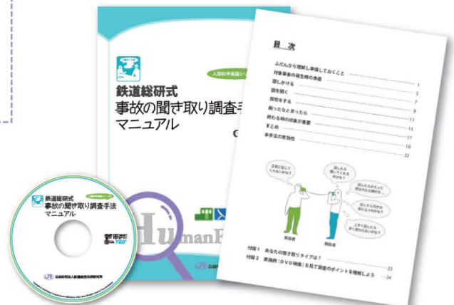
映像付きテキスト教材