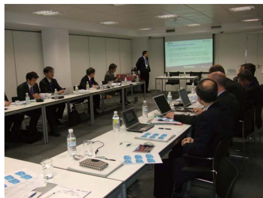
JISC-CENELEC情報交換会 (2008.10、マドリード)