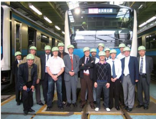
列車内情報制御伝送系 国際会議 (2008.6、東京)