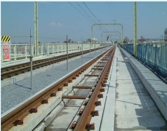
小田急電鉄小田原線