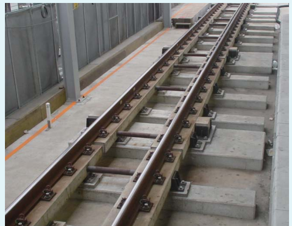
小田急電鉄小田原線