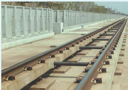
JR北海道学園都市線