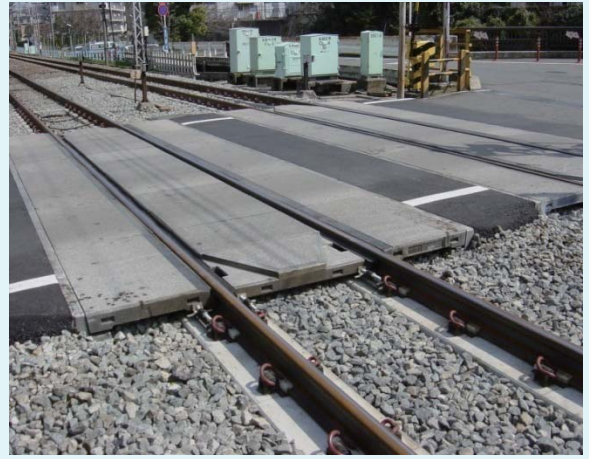
小田急電鉄小田原線 踏切部