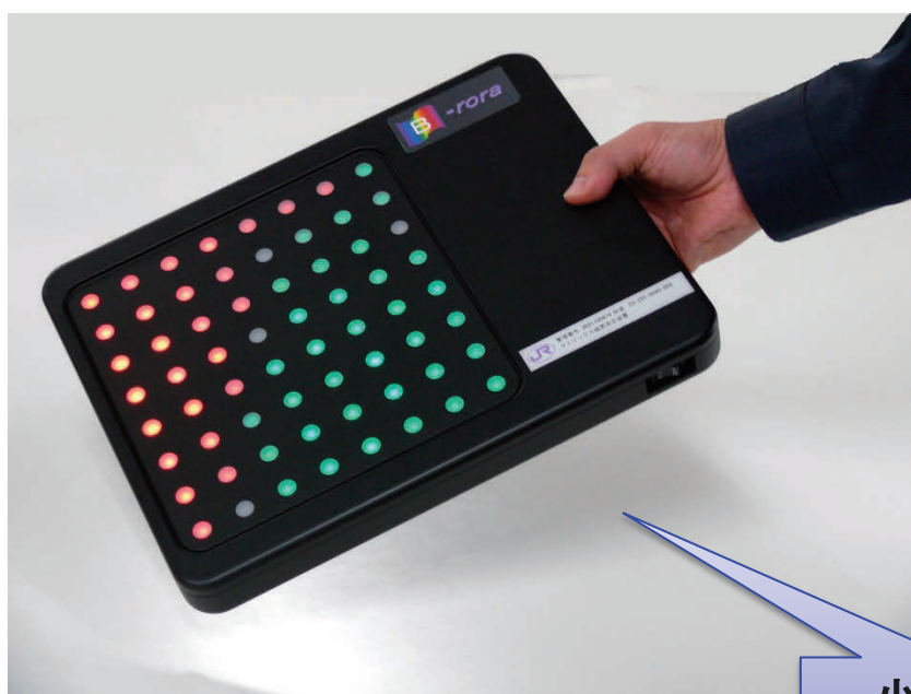
マトリックス方式磁界可視化装置

磁界分布が直観的にわかりやすく、可搬性を重視し、小型(A4ファイルサイズ)、軽量(1.2kg)、省電力(10時間駆動)です。PCと接続し、交流サンプリングや設定変更が可能です。