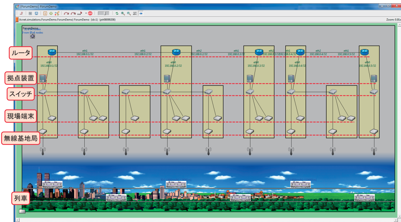
図1 シミュレータの動作例(仮想線区 of システム構成を視覚的に構築)