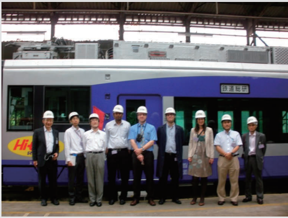
車上電力貯蔵システム (シリーズハイブリッドシステム: PT 62864-1) 国際会議