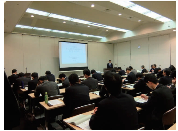
平成27年度 国際規格セミナー (一般編・大阪開催)