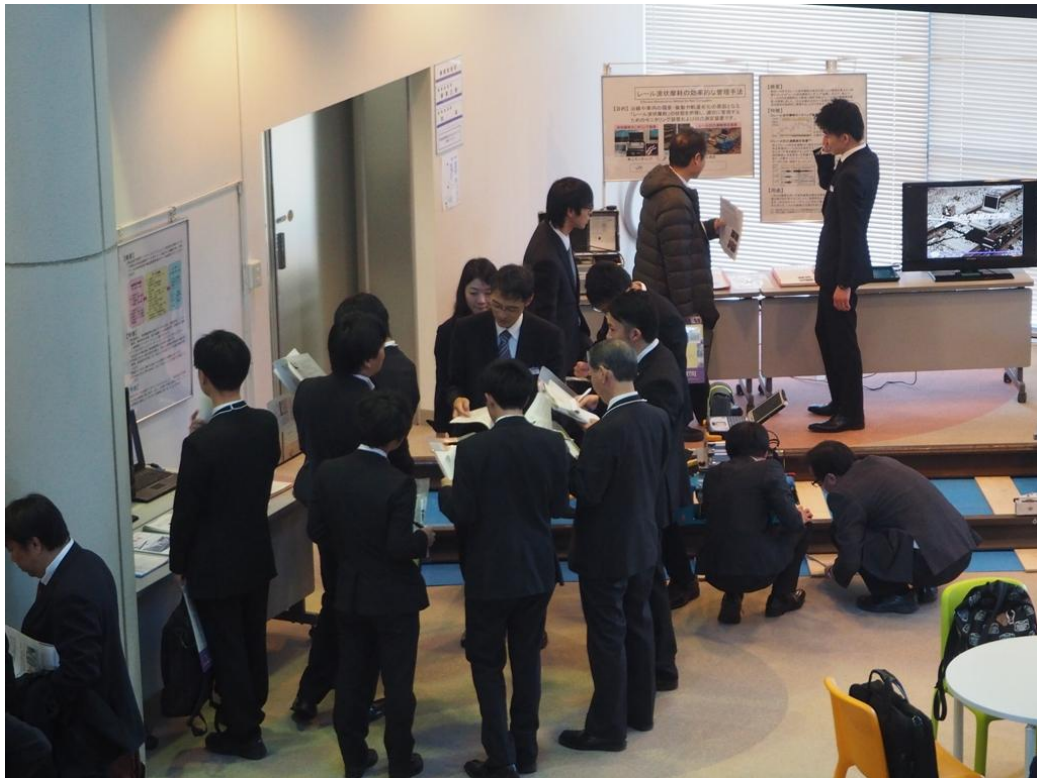
写真 報告会の様子