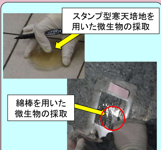
図4 鉄道設備内の微生物の採取及び解析