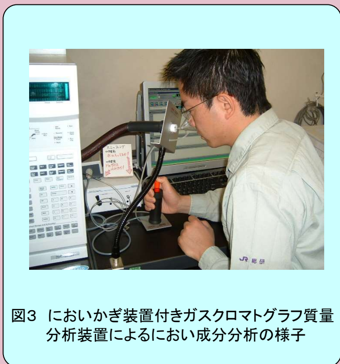
図3 においかぎ装置付きガスクロマトグラフ質量分析装置によるにおい成分分析の様子