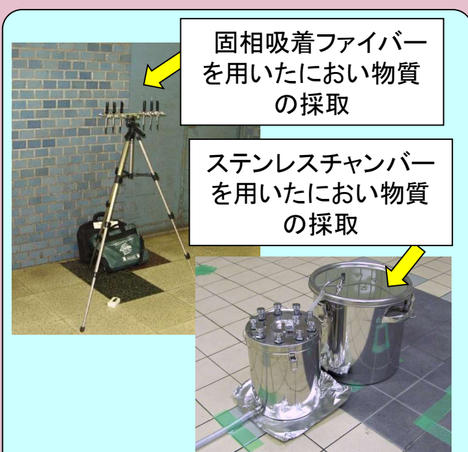
図2 鉄道設備内におい物質の採取