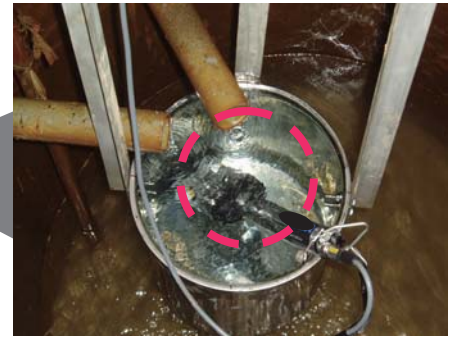
化学センサーで地下水を分析