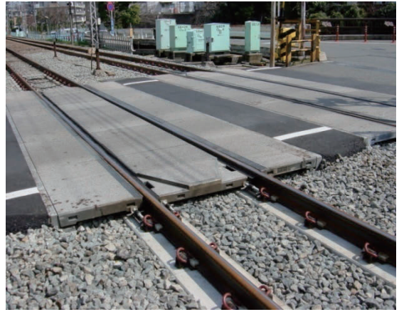
小田急電鉄小田原線 踏切部