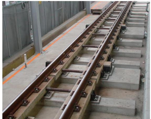
小田急電鉄小田原線