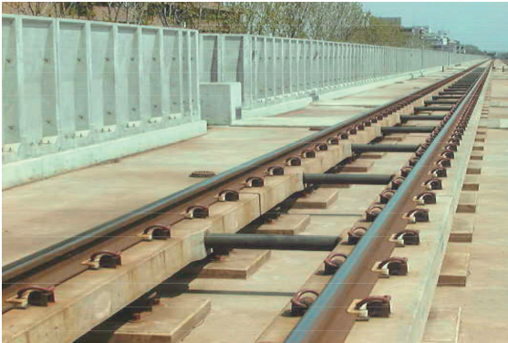
JR北海道学園都市線