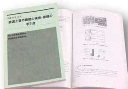
鉄道土留め擁壁の検査・修繕の手引き