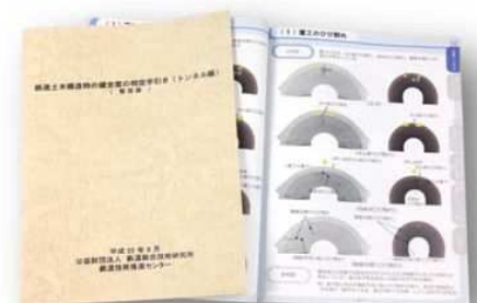
鉄道土木構造物の健全度判断手引き