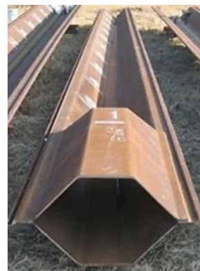
図2 先端加工鋼矢板

先端部に閉塞（へいそく）断面を設けた「先端加工鋼矢板」（図2）によって、鋼矢板の鉛直支持力が向上します。「先端加工鋼矢板」は、N値20～30程度の中間層（非液状化層）においても、地盤強度に応じた一定の支持力があるため、新マニュアルでは中間層の打ち止めにも適用できます。