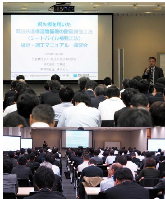
写真2 講習会（11/16）の様子