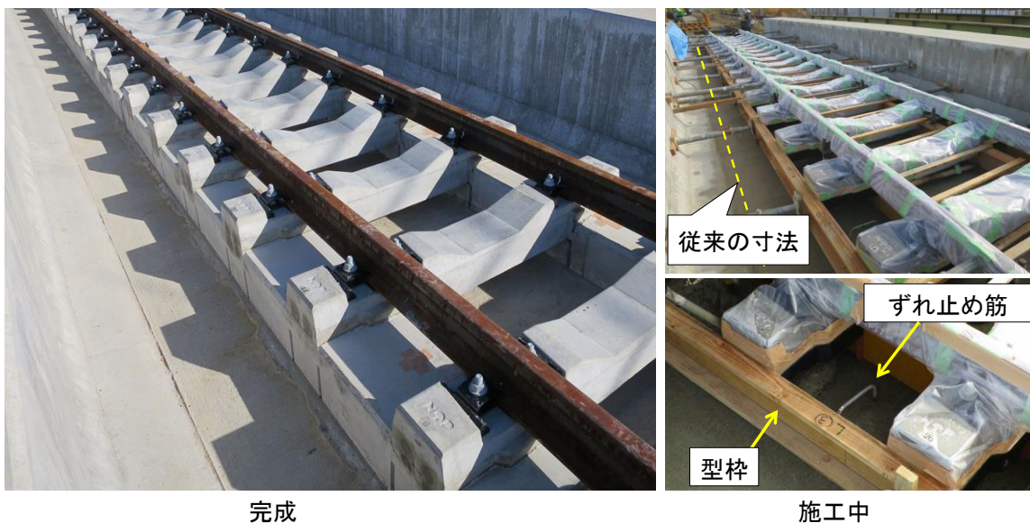
開発したS型弾性まくらぎ直結軌道

公益財団法人鉄道総合技術研究所（以下、鉄道総研）は、従来の弾性まくらぎ直結軌道と比べて、施工が容易で低コストな「S型弾性まくらぎ直結軌道」を開発しましたのでお知らせします。