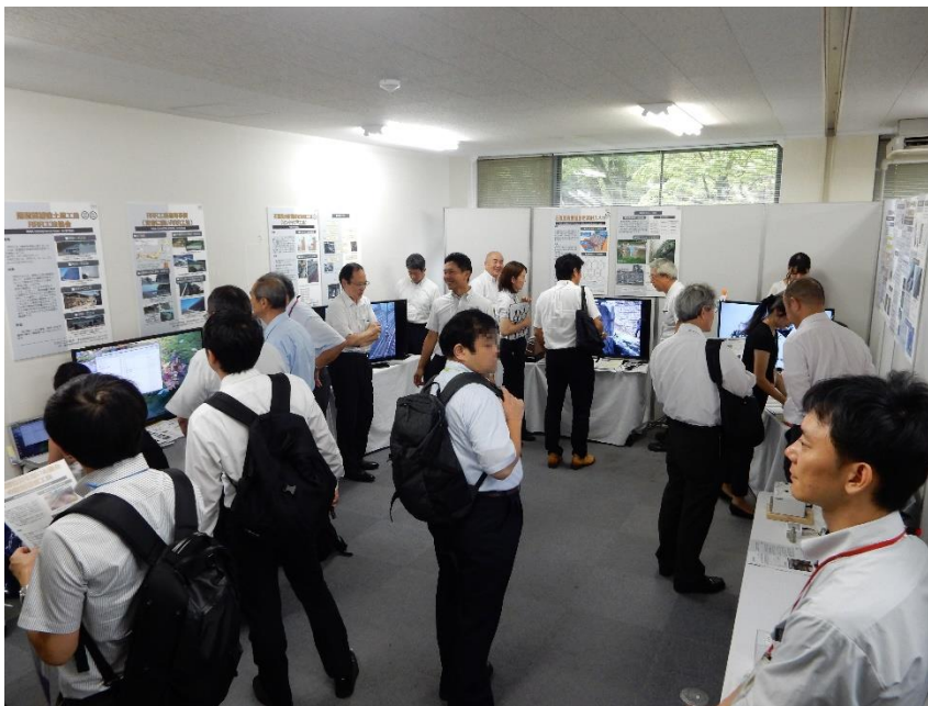
写真 「鉄道総研技術フォーラム2018（国立開催）」成果展示