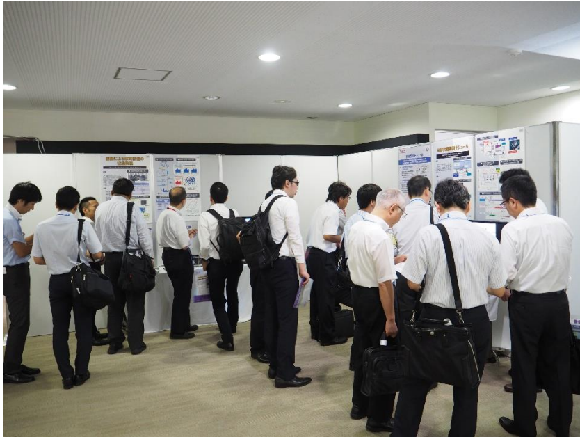
写真 「鉄道総研技術フォーラム2018（国立開催）」メインテーマゾーン