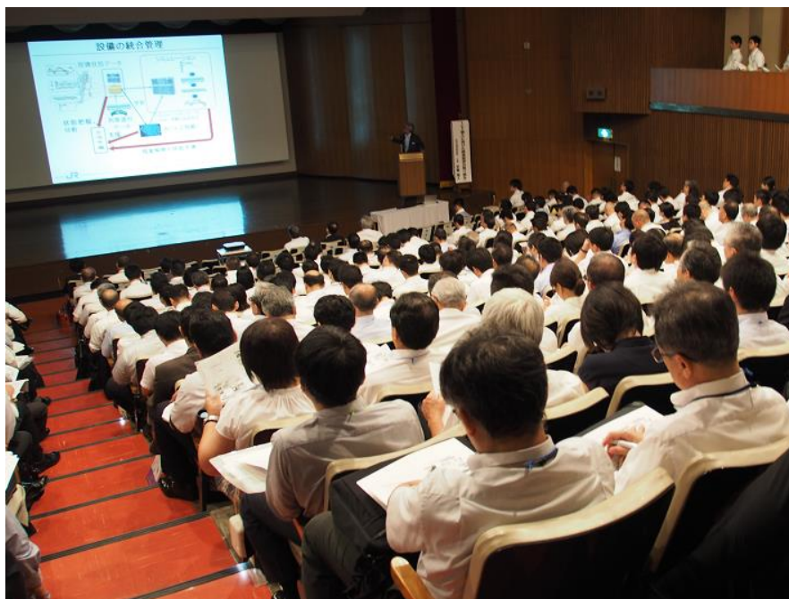
写真 「鉄道総研技術フォーラム2018（国立開催）」講演会