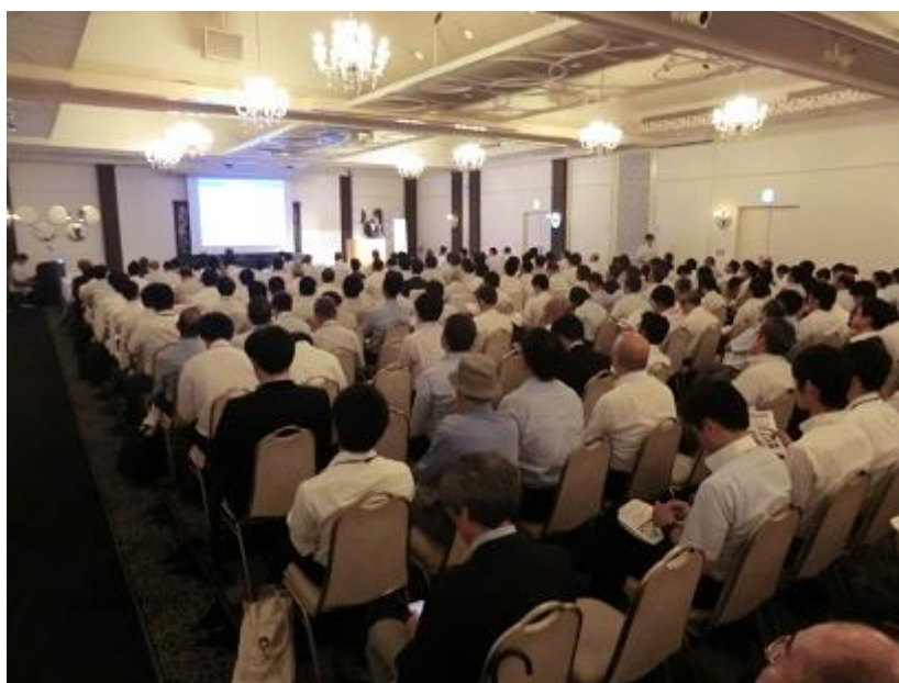
写真 「鉄道総研技術フォーラム2018（大阪開催）」講演会