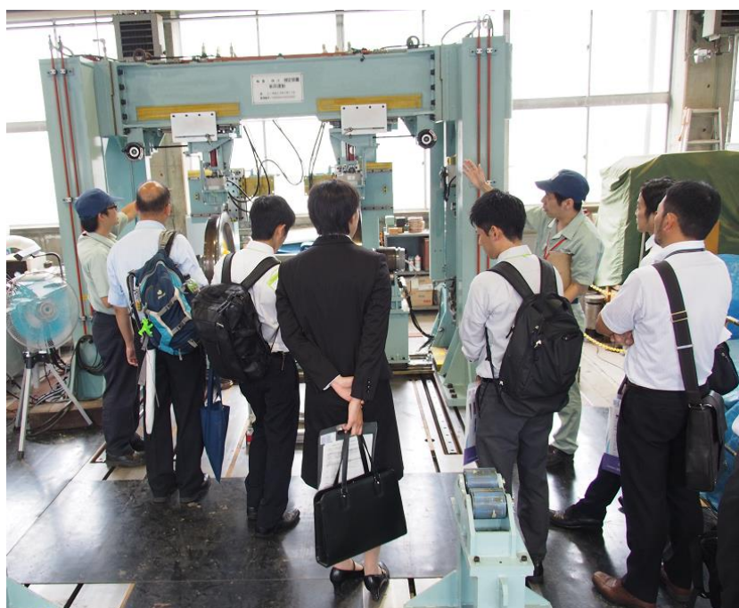
写真 「鉄道総研技術フォーラム2018（国立開催）」設備公開