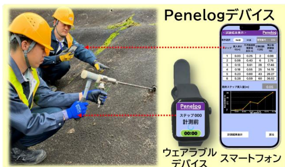
図1 Penelog デバイスの外観