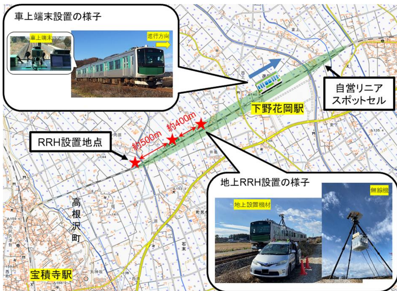
図3 実証実験を実施したJR東日本 烏山線沿線の実験エリアと機材設置の様子 地理院地図(国土地理院)を利用

実験の内容としては、32GHz帯の電波を使い、RRHに取り付けた指向性のあるホーンアンテナでリニアスポットセルを形成し、リニアスポットセル突入時の自営網への接続切替えと、接続先の3台のRRHをシームレスに切り替える接続実験を行いました。また、地上に設置した複数のカメラから車上端末への複数動画同時伝送実験を行いました。サービスエリアには下野花岡駅も含まれており、走行速度60km/hでの突入時における接続切替実験のみでなく、駅での停車までの速度変化による接続安定性などを評価しました。