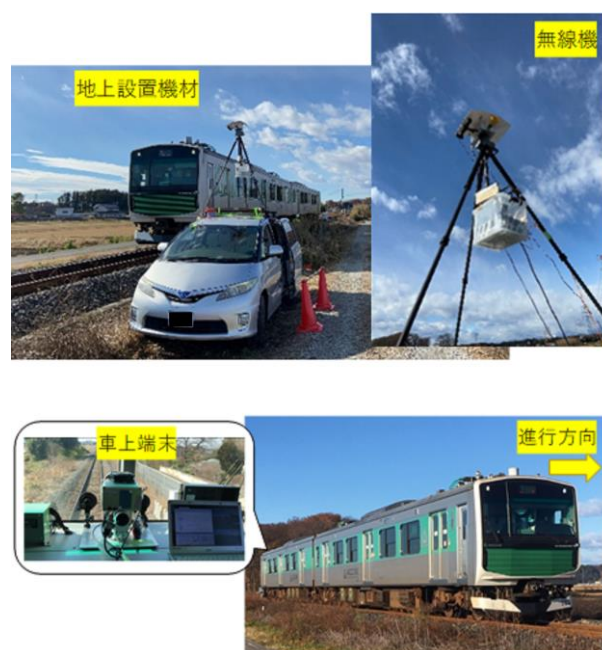
図1 実証実験での無線機設置の様子(上:地上、下:車上)