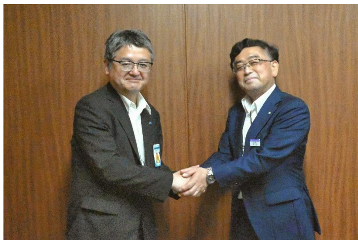
共同研究の開始に際して会談した

分野横断分析が有効な検査項目、分野間で重複している作業の抽出等を行います。そのうえで、①で得られる新たな異常検知手法や劣化診断法などを実務に適用した場合の業務フローを提案し、業務改善効果を検討します。