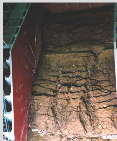
図3 盛土の降雨耐力評価試験