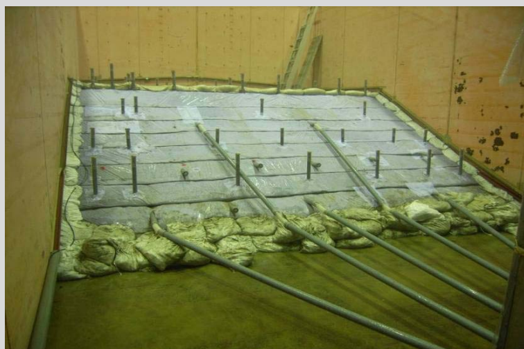
図2 排水工の性能評価試験