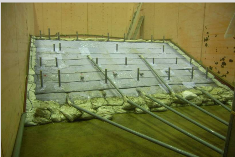
図2 排水工の性能評価試験