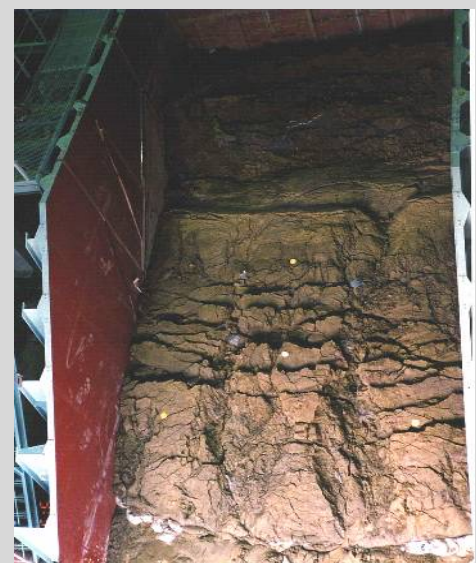
図3 盛土の降雨耐力評価試験