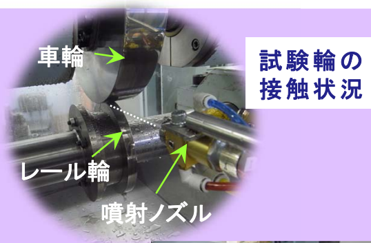
試験輪の接触状況