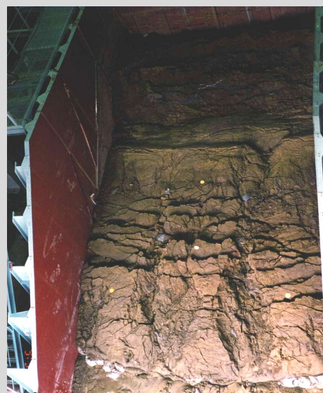
図3 盛土の降雨耐力評価試験