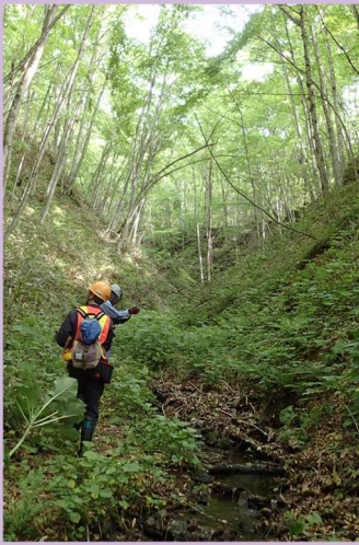
図1 現地踏査の実施状況

新設・既設の鉄道沿線の斜面を調査し、降雨時の崩壊や落石の危険性を示した斜面管理図を作成します。また、これらの評価結果に基づいた対策をご提案します。