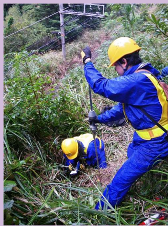
図3 簡易動的コーン貫入試験の実施状況