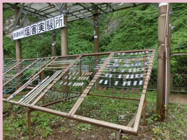
図2 各種材料の耐塩害性評価試験