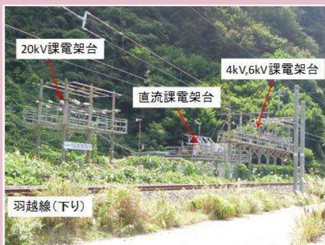
図1 試験設備の概観

□ 概要 塩害は電気設備の安全性を損なう要因となることから、その対策が求められています。本実験所では、耐塩害性材料の課電試験や耐候性評価などが可能です。