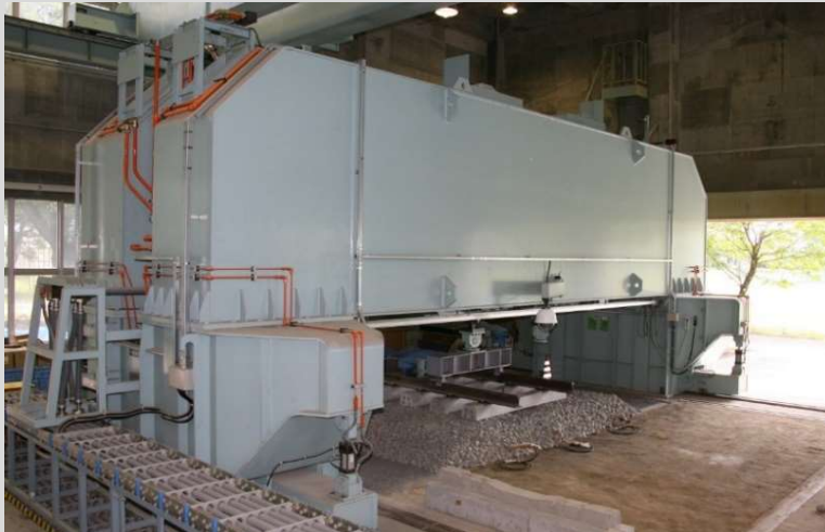
総合路盤試験装置

概要 実物大規模の路盤や軌道に対して、列車荷重を模擬した連続載荷が可能な試験装置です。本装置は試験土槽が4つあり、試験条件に合わせて路盤・路床を構築でき、路盤を含めた軌道の変形を総合的に評価することができます。