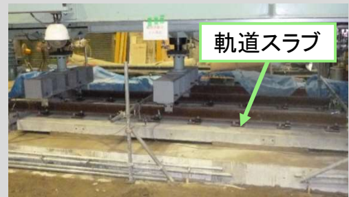
実物大軌道模型の例(軌道スラブ)