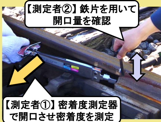
図1 鉄片を用いた密着度測定

概要 開口量表示器は、密着度測定時におけるトンゴレール先端の開口量が所定値に達したことを音で通知します。開口量確認のための鉄片挿入操作が不要になるため、密着度測定を1名で実施できるとともに、安定した測定が可能となります。