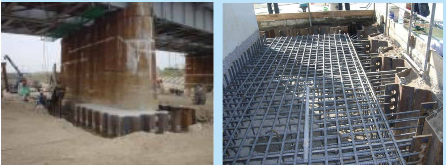
図2 シートパイル補強の例

※本工法は、株式会社大林組、新日鐵住金株式会社(現 日本製鉄株式会社)と共同で開発したものです。