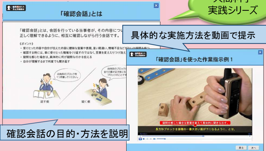
図2 DVDに収録されている確認会話の実施例